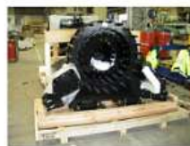
Гусеничный модуль для виброисточника NOMAD-65

Заявитель: ООО «ТНГ-Групп» Сумма: 95,3 млн руб. Окончание работ: декабрь 2023 г.