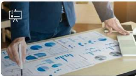
Прототипирование и разработка