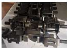
Штампующие цепи для карамели

Заявитель: ООО «Объединенные кондитеры» Сумма: 34,3 млн руб. Окончание работ: апрель 2023 г.