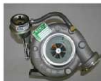
Турбокомпрессор CZ (Чехия) ЯМ3-534

Заявитель: ПАО «Автодизель» Сумма: 26,06 млн руб. Окончание работ: июнь 2023 г.