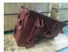
Комплект Картер коробки перемены передач 2765010-17.01.017 - Верхняя половина 2765010-17010016 - Нижняя половина

Заявитель: АО «Петербургский тракторный завод» Сумма: 16,1 млн руб. Окончание работ: март 2024 г.