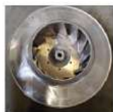
Крыльчатка вентилятора Punker ZN405

Заявитель: АО «Евротехника» Сумма: 18,1 млн. руб. Окончание работ: РКД разработана