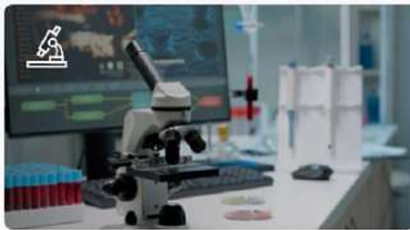
Исследования в биомедицине